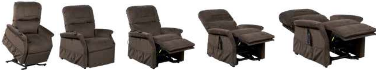
VELOURS «SOFT TOUCH» R++ (EXPLICATIONS P6)

Possibilité d'adapter un mécanisme d'extension du repose pieds (explications p25)