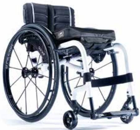
XENON 2 FF LE PLUS LEGER