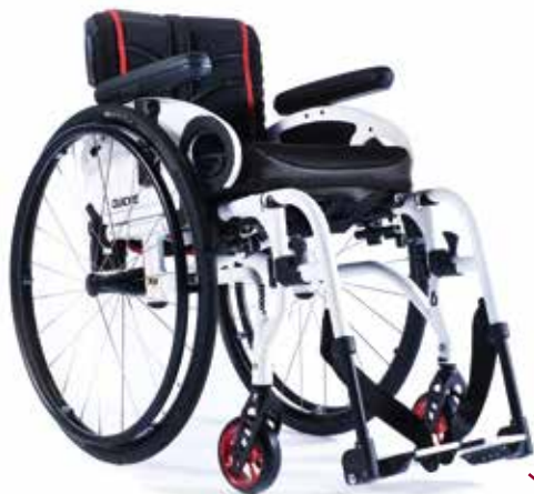
XENON 2 SA LE PASSE-PARTOUT