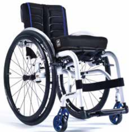
XENON 2 HYBRID LE PLUS RIGIDE